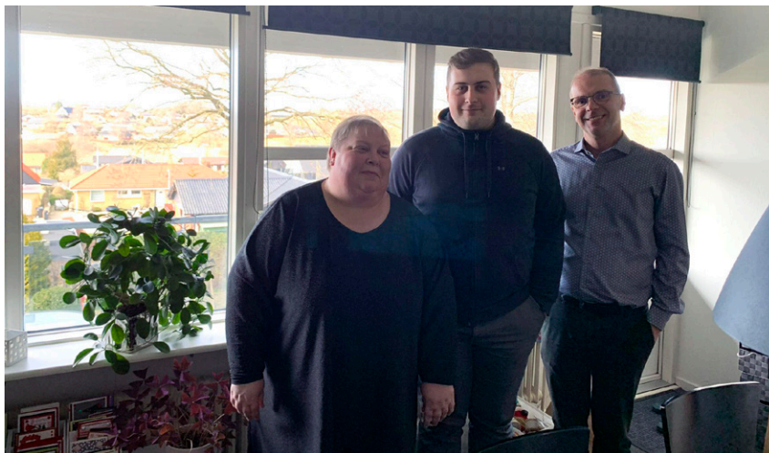
Fra den nyrenoverede altan er der god udsigt over både have og grønne områder.

Ullas rækkehus er på 125 m 2 i forskudte plan og indeholder 4 rum. Udenfor er der en dejlig lukket have. Så der har været gode ram-