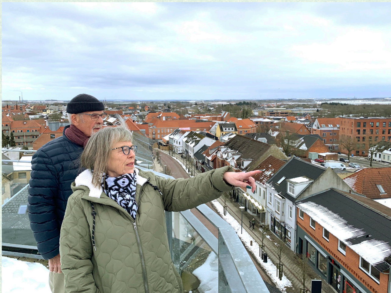
Fra tagterrassen er der en fantastisk udsigt over Aars by.